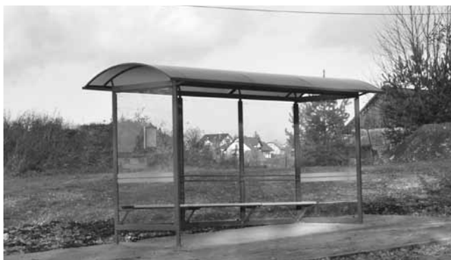
Przystanek autobusowy przy Urzędzie Gminy.