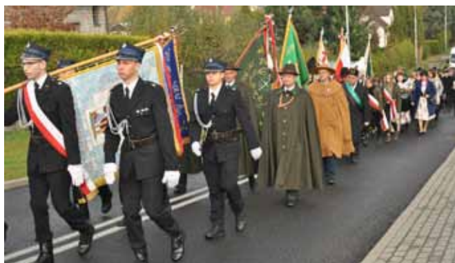
Pochód ulicami Bestwiny.

Końcem sierpnia wspólnie z wiceministrem sportu otwieraliśmy położony poniżej kompleks lekkoatletyczny. Młodzież ze wszystkich szkół z naszej gminy przekazywała sobie sztafetową pałeczkę. Jest to bardzo wymowny symbol, nie tylko w kon-