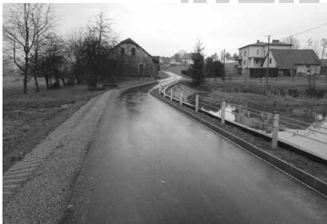
Ul. Okrężna w Bestwinie.

Chociaż w Kaniowie istnieją już pełnowymiarowa hala sportowa i boisko LKS „Przełom”, to brakowało do tej pory ogólnodostępnego obiektu pod gołym niebem, na którym każdy mógłby rozwijać sportowe pasje, nawet przy nieprzychylnych warunkach pogodowych. Zainstalowane sprzęty do gier zespołowych wręcz zachęcają do wypróbowania możliwości boiska. Całości dopełniają ławki do odpoczynku, nawierzchnie brukowe i oświetlenie.