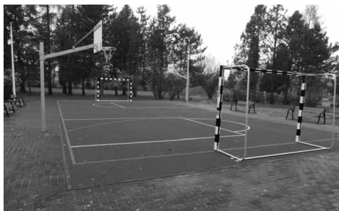
Boisko wielofunkcyjne w Kaniowie.

Opracowanie: Referat Służb Technicznych UG, Sławomir Lewczak