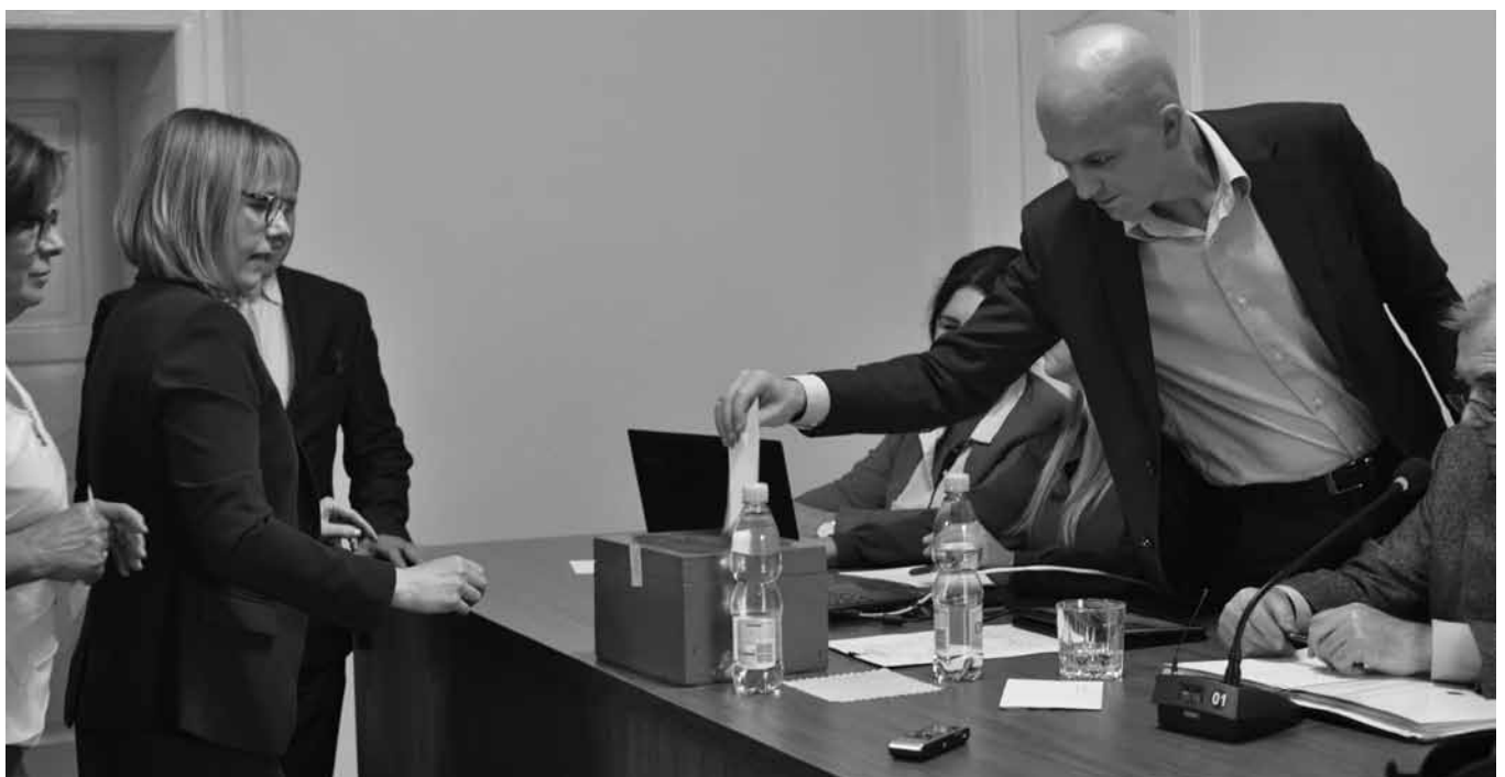
XIII sesja - wybory ławników