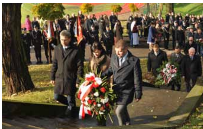
Złożenie kwiatów pod pomnikiem.

tekście sportowym. Dotyczy również dzisiejszego święta. Po mału odchodzą świadkowie przeszłości, coraz mniej osób pamięta II wojnę światową i czas okupacji. Przypomnę, że w tym roku obchodzimy 80 rocznicę agresji niemieckiej i sowieckiej na naszą ojczyznę. Pałeczka pamięci musi wobec tego zostać przekazana młodszym, między innymi w tym celu gromadzimy się pod tym pomnikiem.