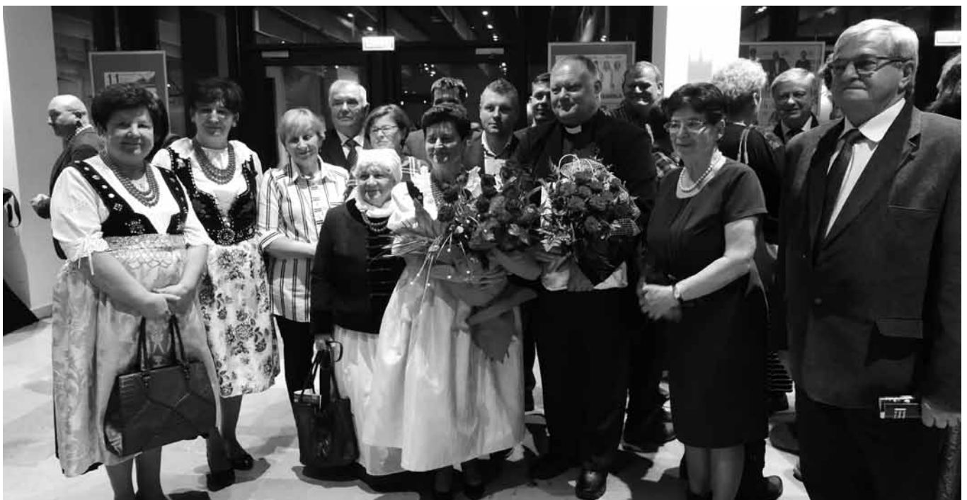
Reprezentacja gminy Bestwina.