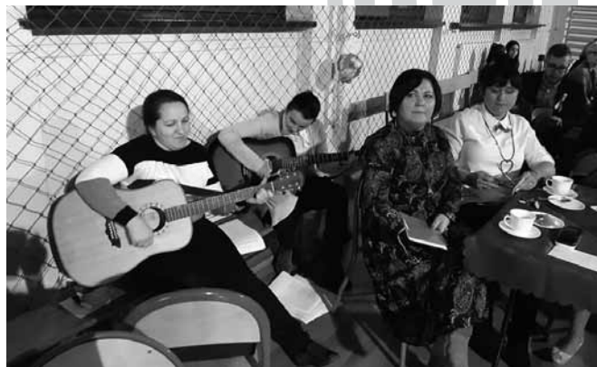
Kaniów - uczestnicy włączyli się we wspólny śpiew.